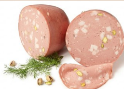
Mortadela Pistacho IMPORTACIÓN