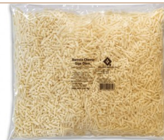
Edam rallado NEUTRO Suave Rallado fácil de usar