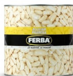
Alubias blancas G. FERBA Alubias blancas Legumbre cocida tradicional