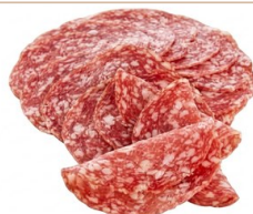
Salami Loncheado ARGAL Sabor clásico