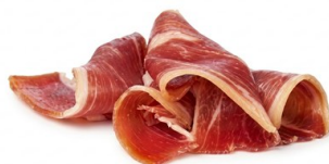
Jamón curado lonchas ARGAL Listo para servir