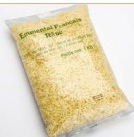
Emmental rallado NEUTRO Fundente Ideal para gratinar