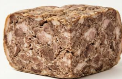
Ciccioni Tranci 1/8 IMPORTACIÓN