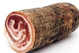
Pancetta Arrotoata al pepe IMPORTACIÓN