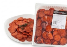
Pepperoni Loncheado ARGAL Embutido con toque picante