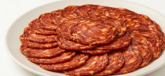
Chorizo Loncheado ARGAL Listo para consumo