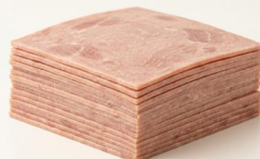
Fiambre cerdo 11x11 Loncheado ARGAL Lonchas regulares