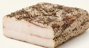
Lardo al pepe nero IMPORTACIÓN