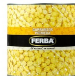
Garbanzos cocidos G. FERBA Garbanzos cocidos Legumbre versátil