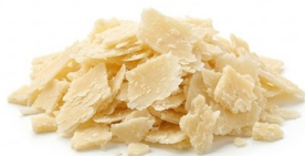
Grana Lascas AMBROSI Corte premium Lascas de queso curado