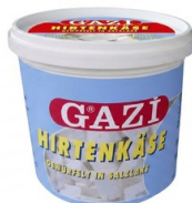
Fetta a dados GAZI Formato práctico Queso en cubos