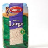
Arroz Vaporizado Largo BAYO Arroz vaporizado Grano suelto que no se pasa