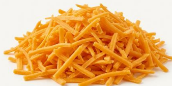
Cheddar Rojo rallado KESEMEISTER Listo uso Queso rallado práctico