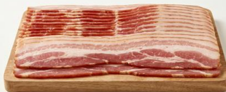
Beicon Loncheado ELLAN Producto práctico y uniforme