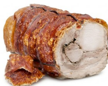
Porchetta tronchetto Arriccia IMPORTACIÓN