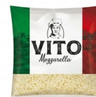
Mozzarella 100% vito 35 M.G. VITO Fundido perfecto Alta elasticidad