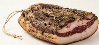
Guanciale stagionato IMPORTACIÓN