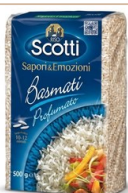
Arroz Basmati SIGNO Arroz aromático Grano largo con aroma característico