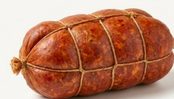
N'Duja Picante Calabra in budello IMPORTACIÓN