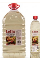
Vinagre blanco -5 lit- BLANCO Vinagre blanco Vinagre en formato grande para uso intensivo