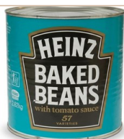
Alubia "Beans" G. HEINZ Alubias preparadas Alubias cocidas listas para consumir