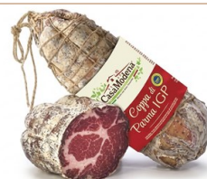
Coppa di Parma IMPORTACIÓN