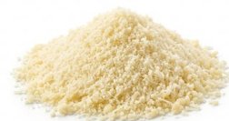
Grana Polvo AMBROSI Sabor intenso Rallado en polvo. Gran calidad